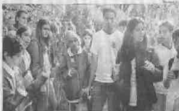
Alunos têm noção de educação ambiental

A realização é fruto de uma parceria entre a Ong Ramudá e a Secretaria Municipal de Educação e Cultura. Até o final de junho, dez turmas de sétimo série das escolas Carmine